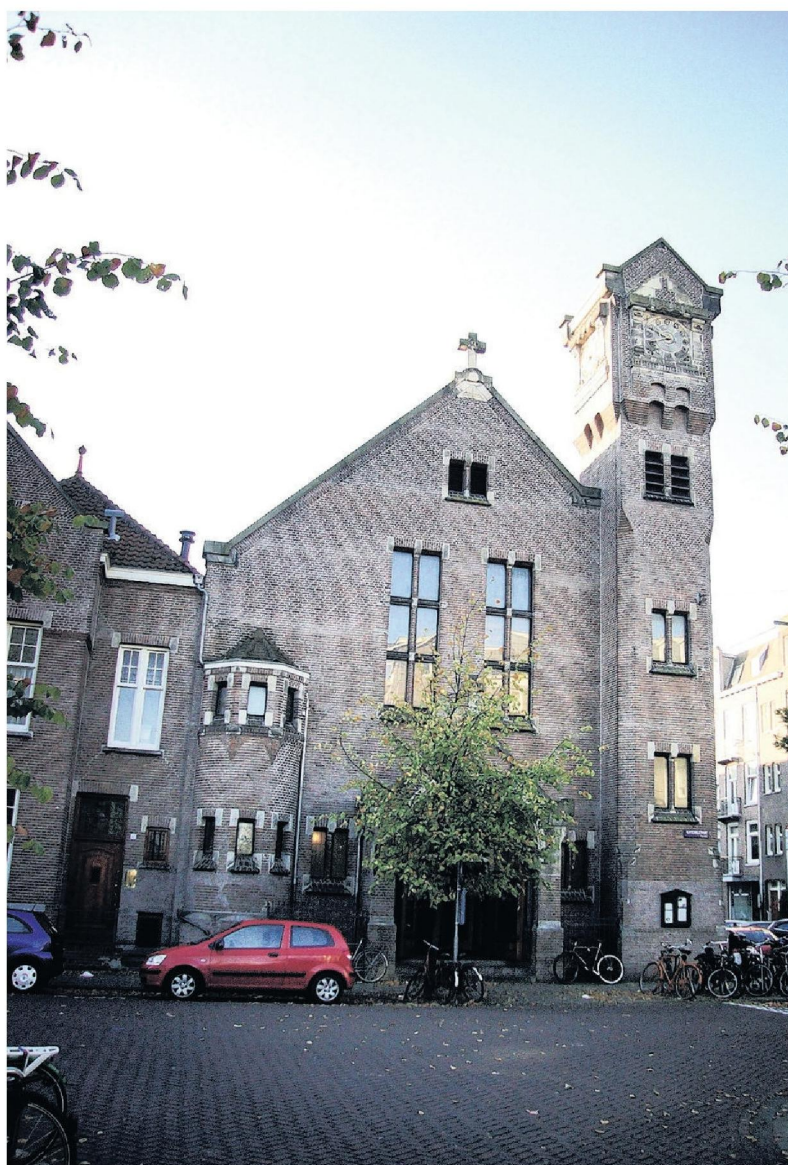
De oud-katholieke kerk in de Ruysdaelstraat nu. Zaterdag is hier het symposium.