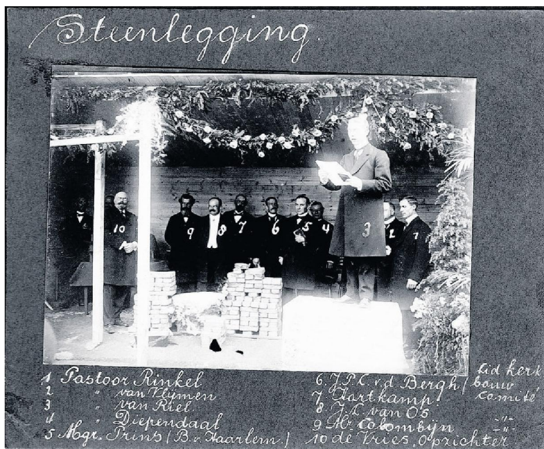
De eerste steen wordt gelegd, 29 mei 1913. De oplevering was in 1914. PRIVÉFOTO'S